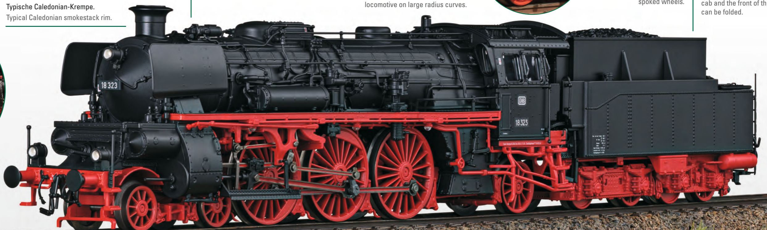
Typische Caledonian-Krempe. Typical Caledonian smokestack rim.

This model can be found in an AC version in the Märklin H0 assortment under item number 38323.